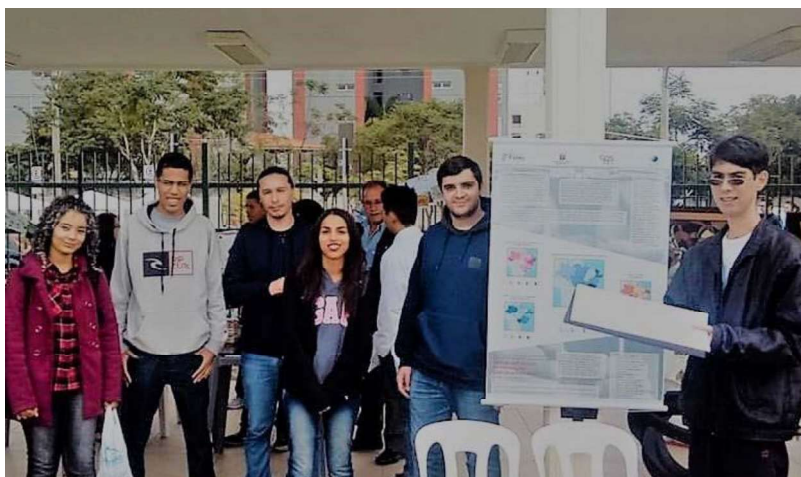
Figura 2. Apresentação do Resultado em Evento Fatec Jacareí – FATEC no Parque 2017-1

Em termos de resultados positivos o projeto possibilitou o aumento de performance e a própria revelação de alguns talentos dentre a sala, motivando-os a perseguir um alto padrão de excelência em suas entregas, uma vez que o projeto se baseou em um ambiente figuradamente corporativo e um segundo resultado significativo também foi a aplicação dos conceitos da disciplina na geração de um produto seguindo critérios profissionais, e um último fruto que se destacou com a iniciativa foi o grande estímulo ao trabalho em equipe.