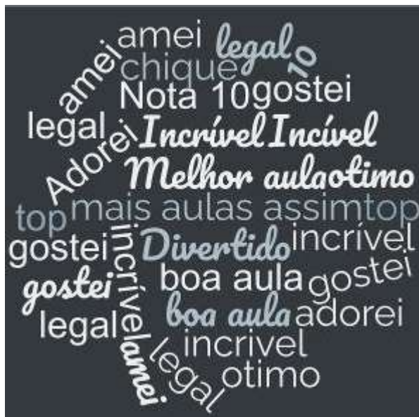
Figura 7 – nuvem de palavras