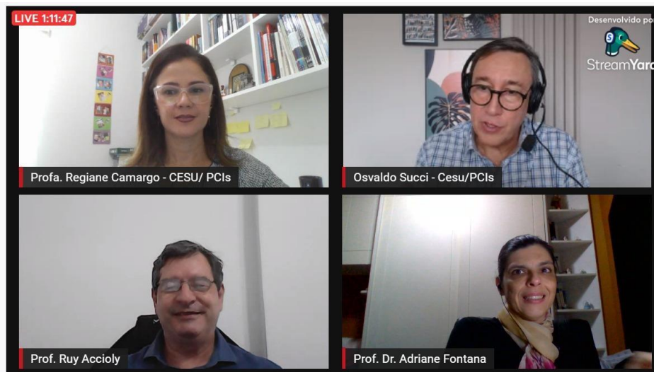
Painel “Gestão da Internacionalização em Casa”